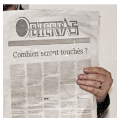
CD 2 titres « Combien seront touchés ? »