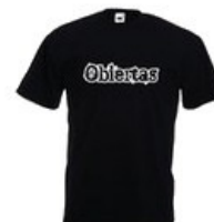
T-Shirt Homme Taille XL