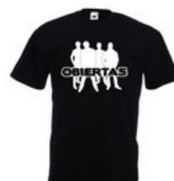
T-Shirt Homme Taille XL