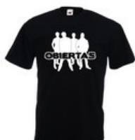
T-Shirt Homme Taille L