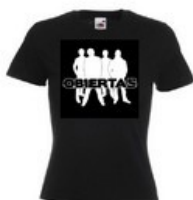
T-Shirt Femme Taille M