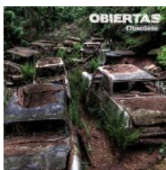
CD 6 titres « Obsolète »